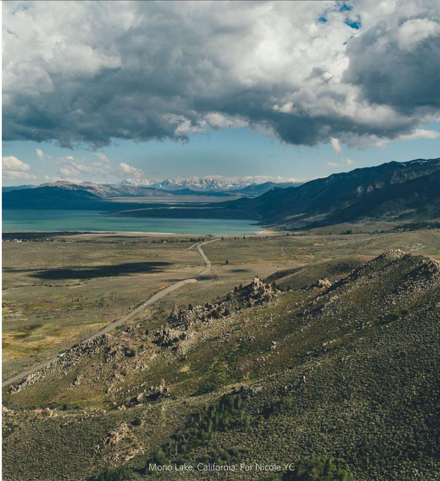
Mono Lake, California. Por Nicole YC