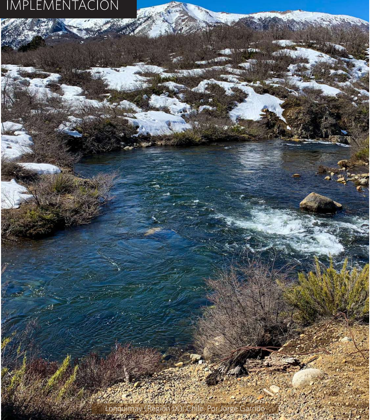
Longuimay (Región IX), Chile.